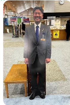
塩崎RC等身大パネル

参加者そして、設営されたメンバーの皆様、本当にお疲れ様でした。ありがとうございました。