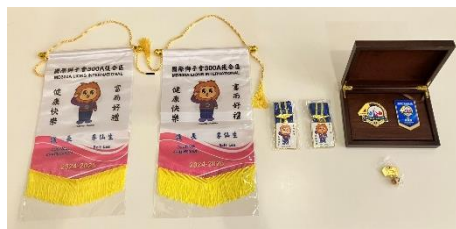
台湾生からクラブへ お土産をいただきました。